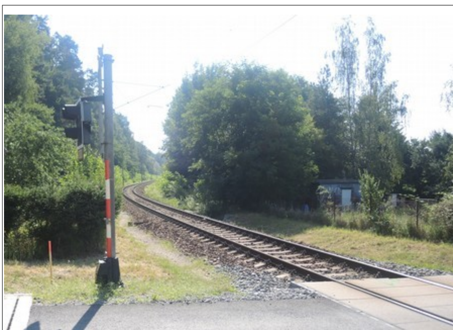
Obr. č. 4: Rozhledová délka L_p ve směru jízdy OA a Ex 1540