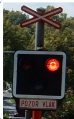
Obr. č. 3: Viditelnost výstražných světel PZZ