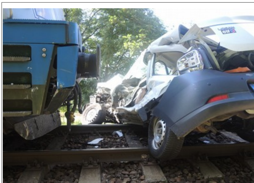
Obr. č. 1: Místo zastavení vozidel