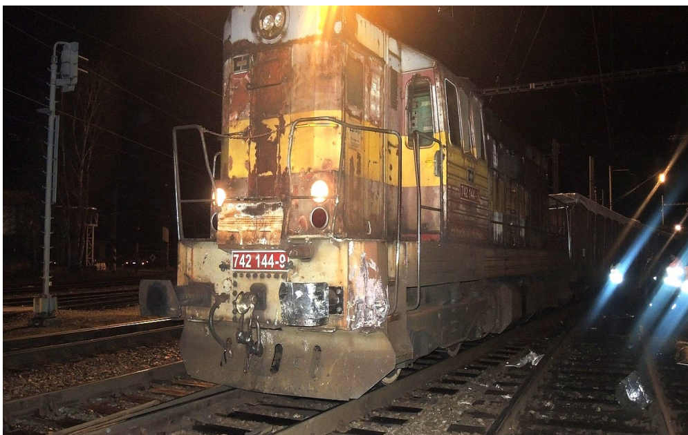
Obr. č. 4: Poškození čela HDV vlaku Mn 83044