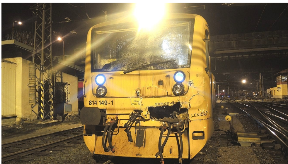
Obr. č. 3: Poškození čela posunového dílu dopravce ČD, a. s.

zamýšlený směr jízdy po koleji 6s, jízdní a brzdicí páka (sdružená jízdní páka) byla v poloze Výběh , přídatná brzda byla v krajní poloze Zabrzděno , oba manometry byly v nulové hodnotě. Motorová jednotka byla rozsáhle poškozena nárazem. Došlo mj. k poškození čela motorového vozu 814.149-1 (viz obr. č. 3), destrukci skleněných přepážek v interiéru řídicího vozu 914.149-0. Vykojila druhá náprava vpravo zamýšleného směru jízdy. Zkouška brzdy na místě vzniku mimořádné události nebyla provedena z důvodu poškození brzdového potrubí. Funkčnost brzdy byla ověřena při následné komisionální prohlídce. Na radiostanici zadního stanoviště HDV 914.149-0 byl navolen simplexní kanál 18 a TRS stuha 63. Orientační dechovou zkoušku na přítomnost alkoholu provedla u strojvedoucího Policie ČR s negativním výsledkem.