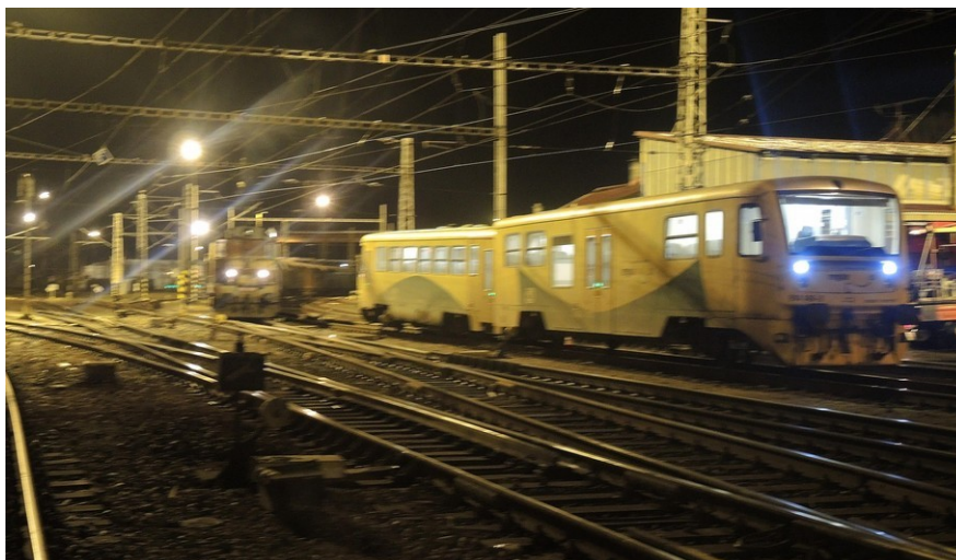
Zdroj: Dražní inspekce