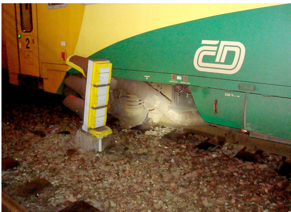
Obr. č. 5: Návěstidlo L6 a vykolejené dvojkolí HDV 814.149-1