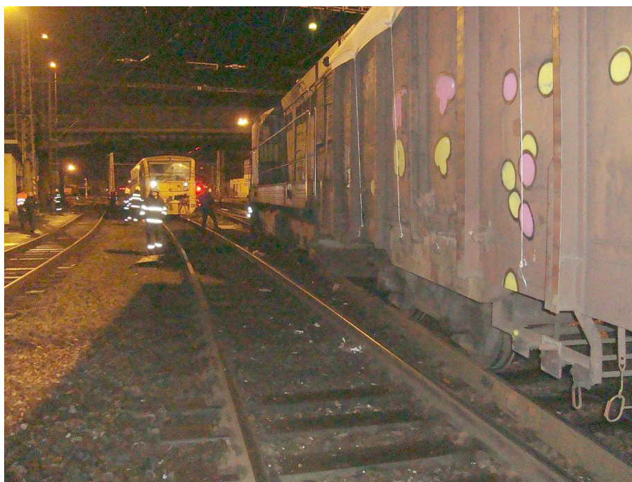
Obr. č. 1: Poloha DV při ohledání místa MU