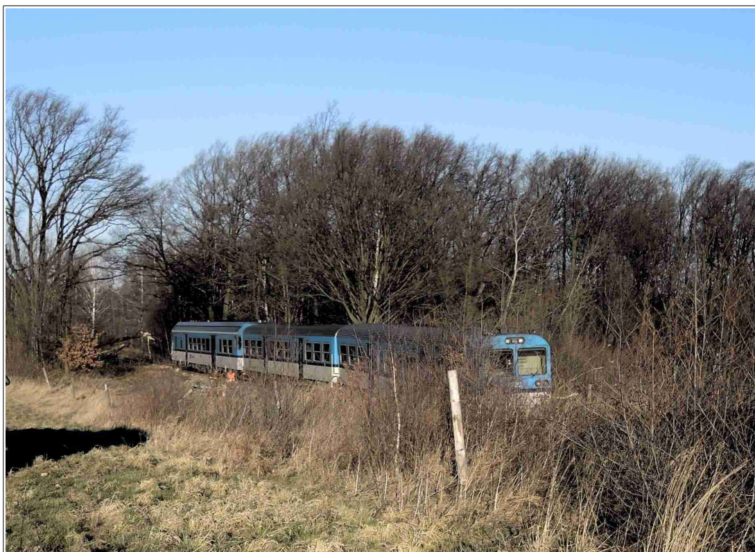
Obr. č. 3: Celkový pohled na místo vzniku MU