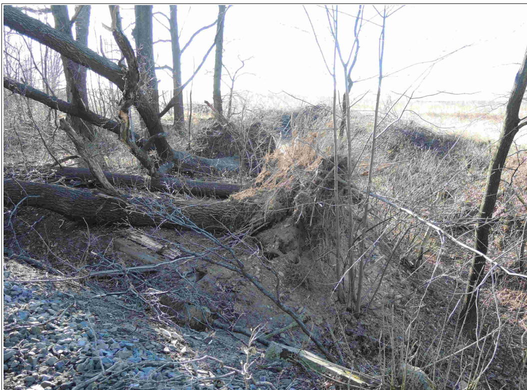
Obr. č. 7: Pohled na kořenové baly spadlých tří dubů