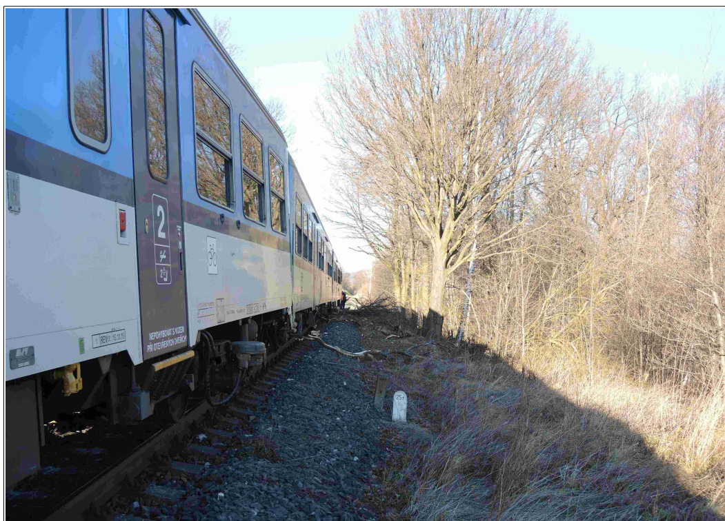
Obr. č. 6: Pohled od čela vlaku na větve korun spadlých tří dubů vlevo vlaku Sp 1661