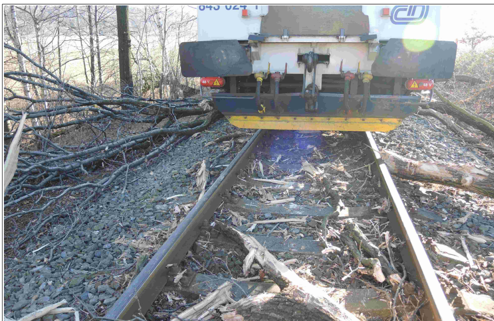
Obr. č. 1: Místo vzniku MU v km 25,155