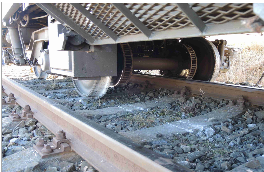
Obr. č. 4: Pohled na vykolejený přední podvozek ŘDV vlaku Sp 1661