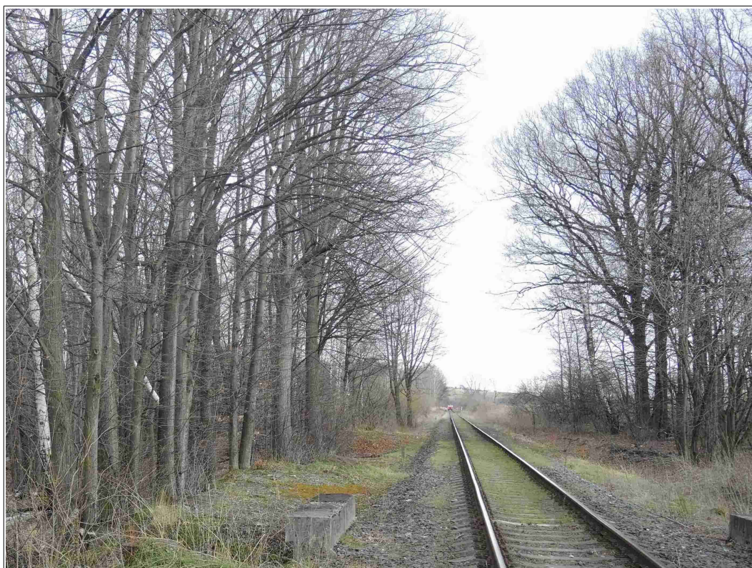
Obr. č. 8: Pohled na nežádoucí vegetaci rostoucí podél TK v dopadové vzdálenosti, za místem vzniku MU