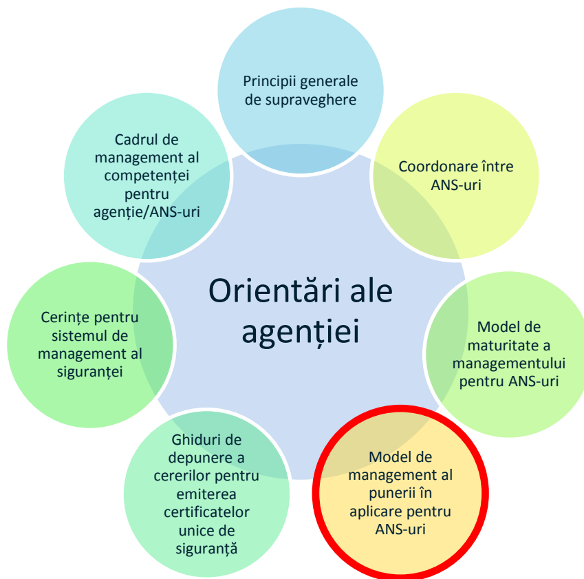
Figura 1: Compendiul orientărilor agenției

Error! Reference source not found. Error! Reference source not found.0