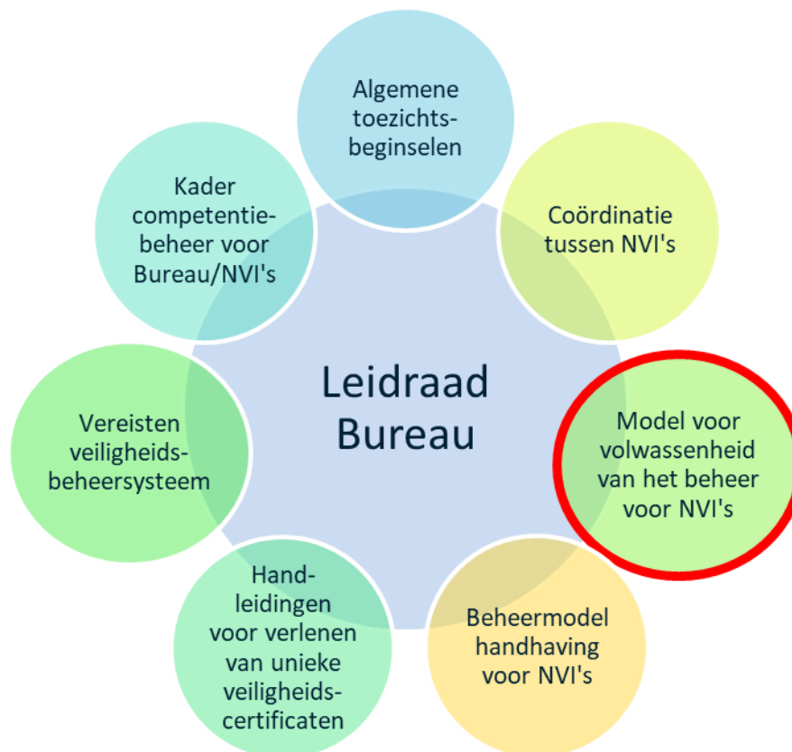
Figuur 1: Compendium van richtsnoeren van het Bureau

In het model voor volwassenheid van management van het Bureau wordt gebruikgemaakt van dezelfde basisstructuur als bijlage I en II van Gedelegeerde Verordening (EU) 2018/762 van de Commissie om een oordeel te vellen over de kwaliteit van het VBS van een organisatie. Drie van de titels van de vereisten zijn enigszins aangepast aan de appversie van de tool, maar de intentie van elk vereiste van het model voor volwassenheid verschilt niet van die van de VBS-vereisten. Het model voldoet ook aan de NVI-behoefte aan een instrument dat kan worden gebruikt om te voldoen aan de vereisten van artikel 7, lid 1, van Gedelegeerde Verordening (EU) 2018/762 van de Commissie voor de evaluatie van de doeltreffendheid van het VBS en in artikel 5, lid 2, van dezelfde Verordening, voor de evaluatie van de veiligheidsbeheerprestaties van de spoorwegonderneming of infrastructuurbeheerder. De in artikel 5, lid 2, vastgestelde benadering is gericht op het creëren van een sterke koppeling tussen evaluatie en daaropvolgend toezicht en vergemakkelijkt een betere informatie-uitwisseling in NVI's en tussen NVI's en het Bureau (dat wil zeggen tussen degenen die toezicht houden en degenen die beoordelingen uitvoeren). Tot slot brengt deze benadering de spoorwegsector meer duidelijkheid over de informatievoorziening van hun eigen veiligheidsprestaties ten behoeve van het NVI-toezicht (bijvoorbeeld prioritering van toezichtactiviteiten voor de gebieden waar de grootste veiligheidsrisico's spelen).