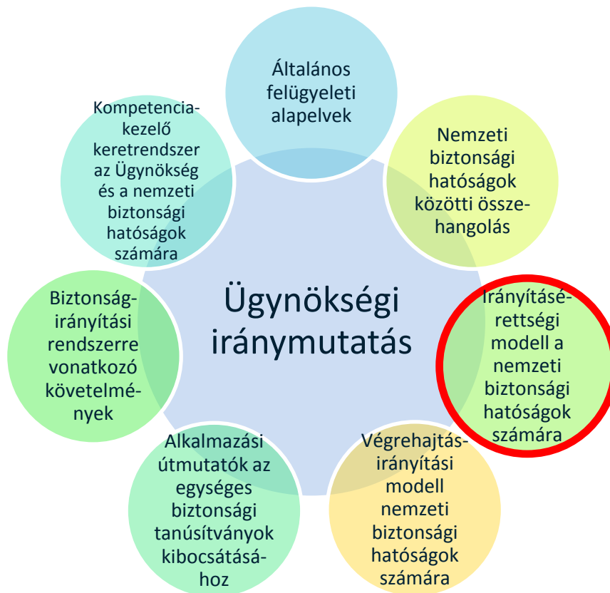
1. ábra: Az Ügynökség iránymutatásainak gyűjteménye