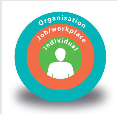
Individas yra socialinės ir techninės sistemos epicentre.

Žmonės yra šios technologinės, socialinės ir organizacinės sistemos epicentre ir lemia jos sėkmę arba nesėkmę.