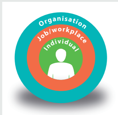
Den enkelte har en central plads i det sociotekniske system.

Mennesker har en central plads i dette teknologiske, sociale og organisatoriske system og er nøglen til succes eller fiasko.