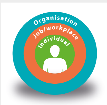
Jednotlivec je v strede tohto sociálno-technického systému.

Ľudia sú v strede tohto technologického, sociálneho a organizačného systému a sú kľúčom k úspechu alebo zlyhaniu.