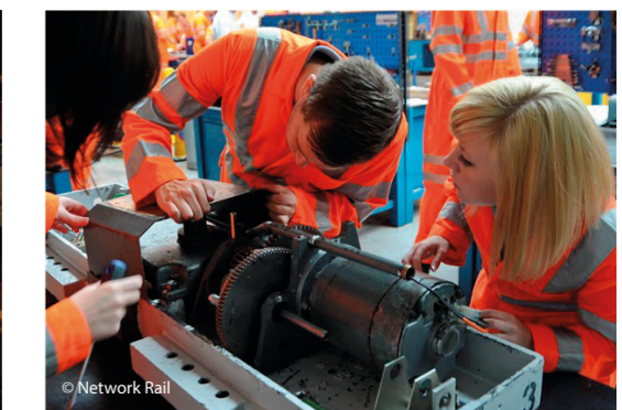
No RSSB adaptēts materiāls