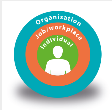
A társadalmi-műszaki rendszer középpontjában az egyén áll.

E technológiai, társadalmi és szervezési rendszer középpontjában az ember van, és rajta áll vagy bukik a sikeres működés.