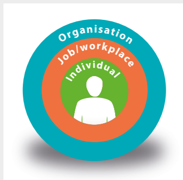
Pojedinac je u središtu društveno-tehničkog sustava.