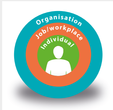
Sotsiaal-tehnilise süsteemi keskmes on inimene. (Joonise reproduktsioon RSSB loal)

Selle tehnoloogilise, sotsiaalse ja organiseeritud süsteemi keskmes on inimesed, kellest sõltub süsteemi edukus või läbikukkumine.