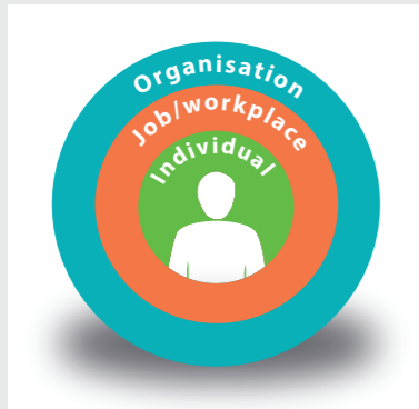
Jednotlivec je jádrem sociálně technického systému

Lidé jsou jádrem tohoto technologického, sociálního a organizačního systému a klíčem k úspěchu či neúspěchu.