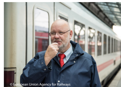
Adapted from RSSB

Конструкцията на продуктите трябва да е целесъобразна, което означава, че още на етап проектиране трябва да се определят правилно както начинът, по който те ще се използват, така и техническите задачи, които са предназначени да решават. Незачитането на човешките фактори при проектирането може да доведе до сериозен спад в ефективността, загуба на служители или клиенти поради злополуки или напускане и в много случаи съществени финансови разходи.