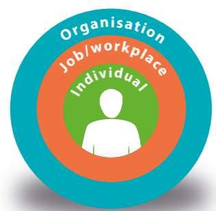
Човекът е в центъра на социално-техническата система.