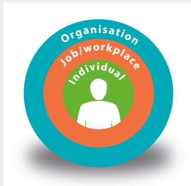
Jednotlivec je v strede tohto sociálno-technického systému.

Ľudia sú v strede tohto technologického, sociálneho a organizačného systému a sú kľúčom k úspechu alebo zlyhaniu.