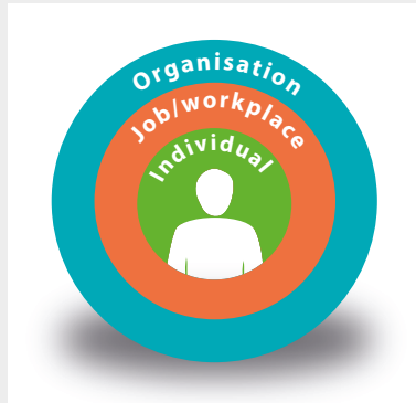
Individul este în centrul sistemului sociotehnic.

Oamenii se află în centrul acestui sistem tehnologic, social și organizațional și sunt factori esențiali pentru succesul sau eșecul acestuia.