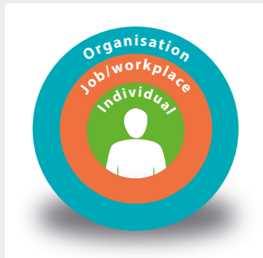
Cilvēks ir sociāltehnikās sistēmas centrā (RSSB materiāls).

Cilvēki ir šīs tehnoloģiskās, sociālās un organizatoriskās sistēmas centrā, un viņos slēpjas veiksmes vai neizdošanās atslēga.