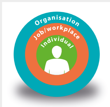
Ο άνθρωπος στο κέντρο του κοινωνιοτεχνικού συστήματος

Ο άνθρωπος βρίσκεται στο κέντρο αυτού του τεχνολογικού, κοινωνικού και οργανωτικού συστήματος και καθορίζει την επιτυχή ή μη λειτουργία του.