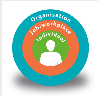
Човекът е в центъра на социално-техническата система.

Хората са в центъра на тази технологична, социална и организационна система и са ключът към успеха или провала.