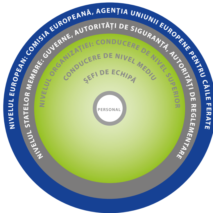
Figura 2: Niveluri care contribuie la cultura siguranței

Articolul 29 din Directiva privind siguranța feroviară prevede că Agenția evaluează evoluțiile în ceea ce privește o cultură a siguranței până la data de 16 iunie 2024. Articolul 9 alineatul (2) prevede obligația administratorilor de infrastructură și a întreprinderilor feroviare de a dezvolta o cultură a încrederii și a învățării reciproce prin intermediul sistemului de management al siguranței. Aceste idei sunt prezentate în cadrul metodei de siguranță comune privind cerințele sistemului de management al siguranței și în orientările asociate privind evaluarea certificatelor unice de siguranță sau a autorizațiilor de siguranță.