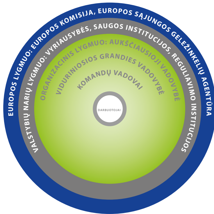
2 diagrama. Saugos kultūros stiprinimo lygmenys

Geležinkelių saugos direktyvos 29 straipsnyje nustatyta, kad Agentūra iki 2024 m. birželio 16 d. įvertina saugos kultūros plėtrą. Pagal 9 straipsnio 2 dalį reikalaujama, kad infrastruktūros valdytojai ir geležinkelio įmonės, pasitelkdamos SVS, vystytų abipusio pasitikėjimo ir mokymosi kultūrą. Šios idėjos išdėstytos bendrajame saugos būde, susijusiame su saugos valdymo sistemos reikalavimais ir atitinkamomis rekomendacijomis, pagal kurias vertinami bendri saugos sertifikatai arba saugos įgaliojimai.