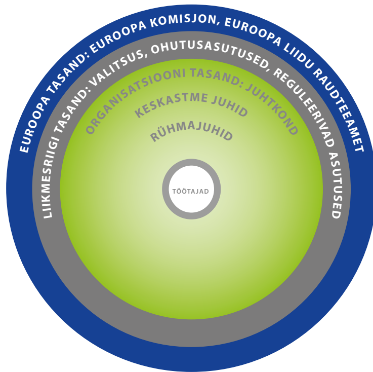
Joonis 2. Ohutuskultuuri toetavad tasandid

Raudteeohutuse direktiivi artiklis 29 sätestatakse, et amet esitab 16. juuniks 2024 ohutuskultuuri arengut hindava aruande. Artikli 9 lõikega 2 nõutakse taristuettevõtjalt ja raudteeveo-ettevõtjalt ohutusjuhtimise süsteemi kaudu vastastikusel usaldusel, usaldusväärsusel ja õppimisel põhineva kultuuri loomist. Neid ideid arendati ohutusjuhtimise süsteemi nõuete ühises ohutusmeetodiga ja juhenditega, kuidas hinnata üksikuid ohutussertifikaate või ohutuslubasid.