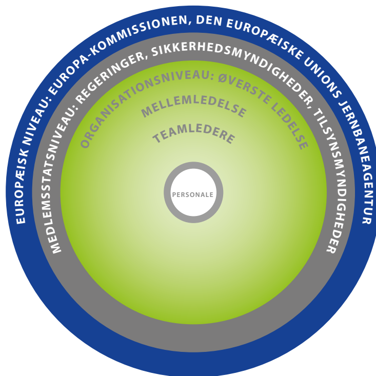
Figur 2: Niveauer, der bidrager til sikkerhedskultur

I jernbanesikkerhedsdirektivets artikel 29 anføres det, at agenturet evaluerer udviklingen af en sikkerhedskultur den 16. juni 2024. I artikel 9, stk. 2, kræves det, at infrastrukturforvaltere og jernbanevirksomheder udvikler en kultur af gensidig tillid, fortrolighed og læring gennem sikkerhedsledelsessystemet. Disse krav er afspejlet i den fælles sikkerhedsmetode (CSM) vedrørende krav til sikkerhedsledelsessystemer og tilhørende vejledning for vurdering af enkelte sikkerhedscertifikater eller sikkerhedsgodkendelser.