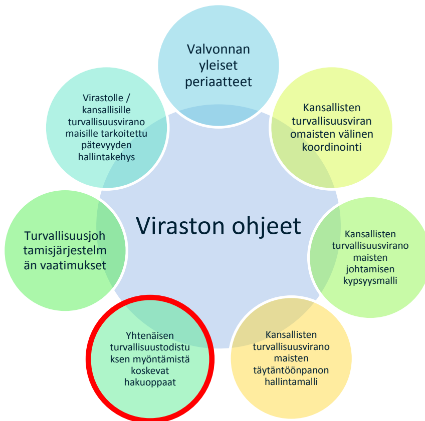
Kaavio 1: Viraston ohjeet

Tämä asiakirja on toinen viraston julkaisemista oppaista, joissa käsitellään yhtenäisten turvallisuustodistusten myöntämistä. Toinen on viranomaisen hakuopas . Se on myös osa viraston ohjeita, joilla tuetaan rautatieyrityksiä, rataverkon haltijoita, kansallisia turvallisuusviranomaisia ja virastoa, kun ne täyttävät ja toteuttavat tehtäviään direktiivin (EU) 2016/798 mukaisesti. Tässä oppaassa julkaistuja tietoja täydennetään toisella, kansallisten turvallisuusviranomaisten laatimalla oppaalla, kuten edellä todetaan.