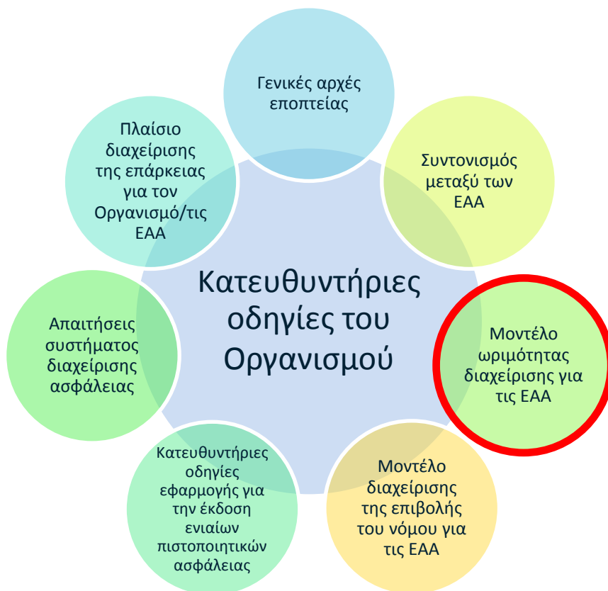
Διάγραμμα 1: Συλλογή κατευθυντήριων οδηγιών του Οργανισμού