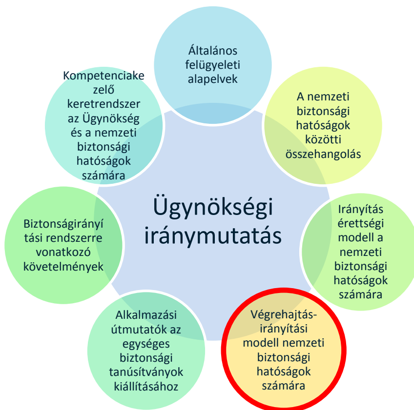
1. ábra: Az Ügynökség iránymutatásainak gyűjteménye

Error! Reference source not found. Error! Reference source not found.0