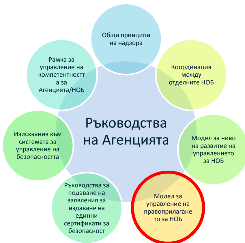
Фигура 1: Набор от ръководства на Агенцията

Error! Reference source not found. Error! Reference source not found.