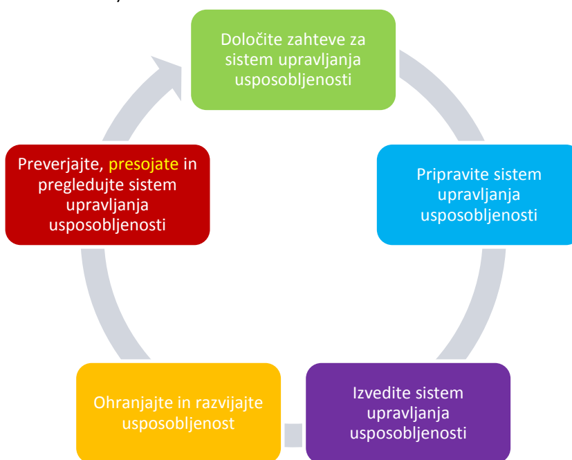
Slika 2: Cikel sistema upravljanja usposobljenosti

Za namene teh smernic in evropskega zakonodajnega okvira je „sistem upravljanja usposobljenosti“ sistem, ki je namenjen zagotovitvi, da je vse osebje, odgovorno za ocenjevanje in nadzorovanje varnosti, usposobljeno za izvajanje svojih nalog in da se v vseh okoliščinah ohranjajo spretnosti in znanje osebja. Tako kot večina sistemov upravljanja vključuje korake priprave, načrtovanja, izvajanja, spremljanja in pregledovanja (glej sliko 2 – Slika 2).